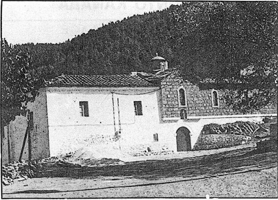
Βασαράς: Ιερά Μονή Αγίων Αναργύρων.